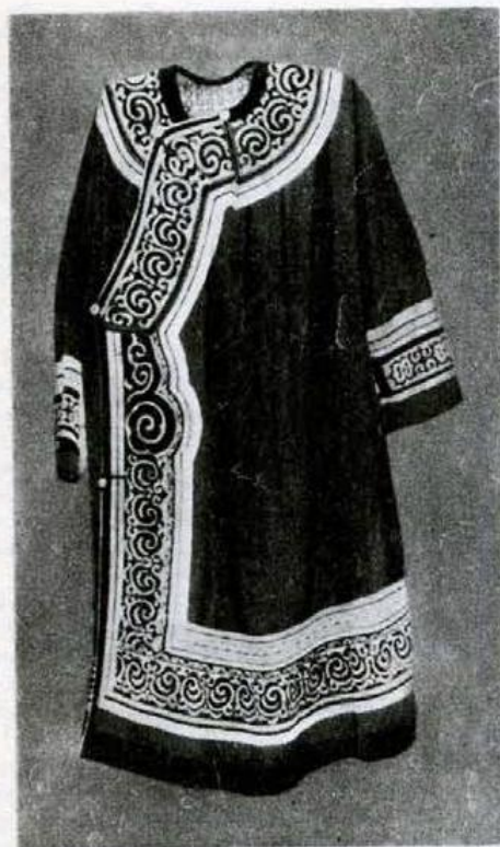
Нанайцы. Традиционная женская одежда.

помощью одной-двух собак). Лыжи обклеивали камусами, изготавливали и голицы. Лодки для дальних и ближних поездок, для охоты, рыболовства имели свою специфику; их изготавливали из кедровых досок (плоскодонки разных форм); оморочки — долблёнки и берестянки служили в основном для охоты и рыболовства. Охотники пользовались разл. заплечными носилками для переноски тяжестей. В сов. период исчезло ездовое собаководство, появились новые виды транспорта — общественного и личного (моторные лодки, мотоциклы и др.).